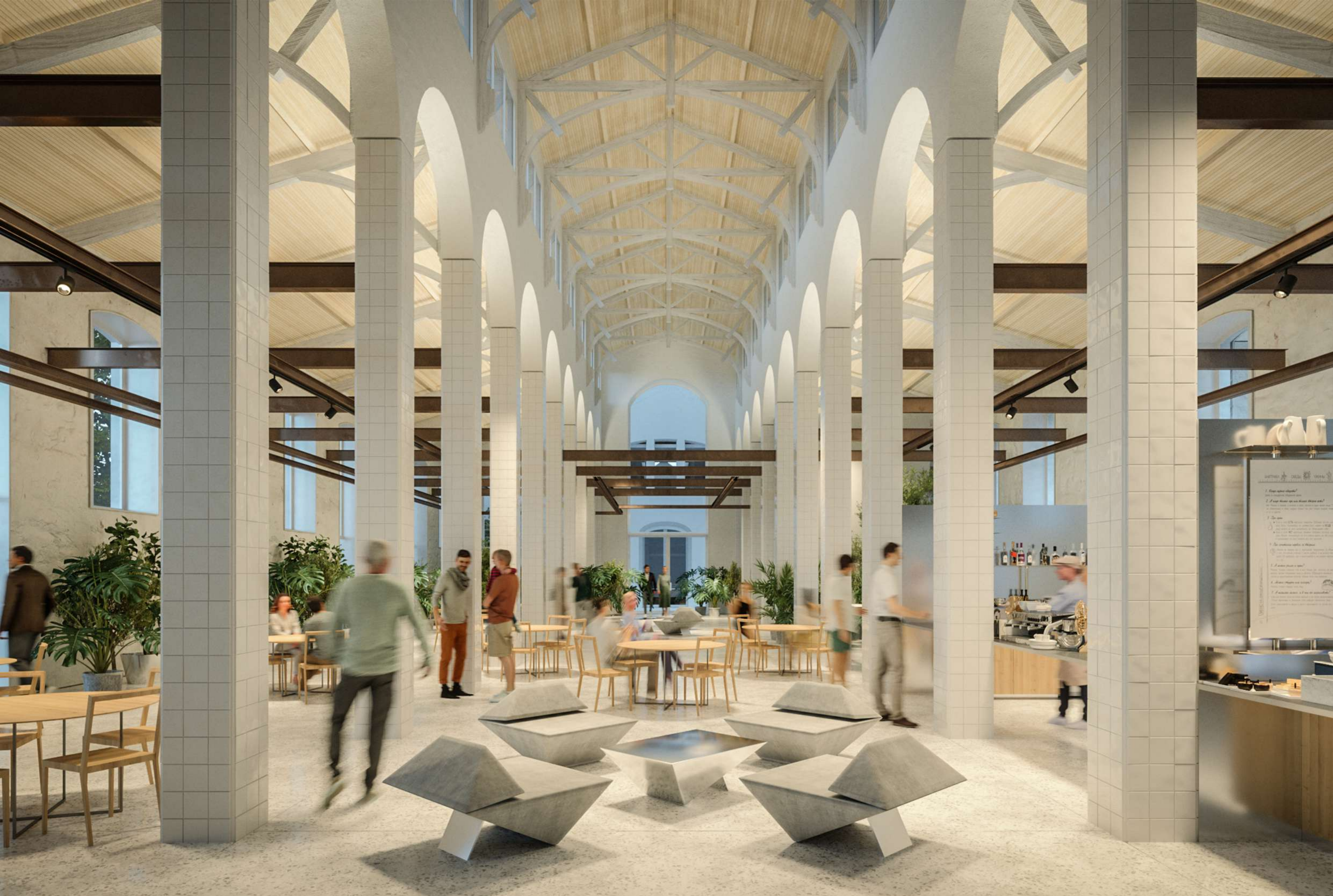
Simulação de restauração